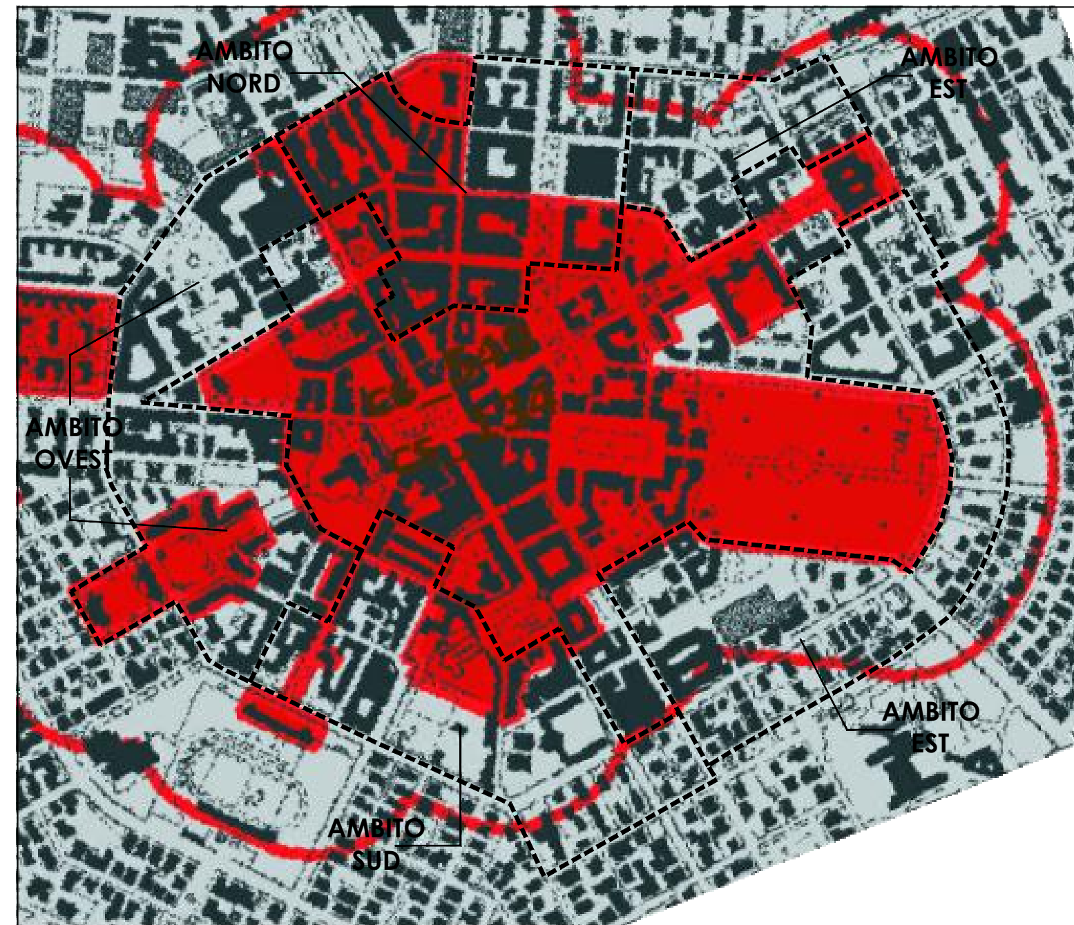
STRALCIO DI PTPR